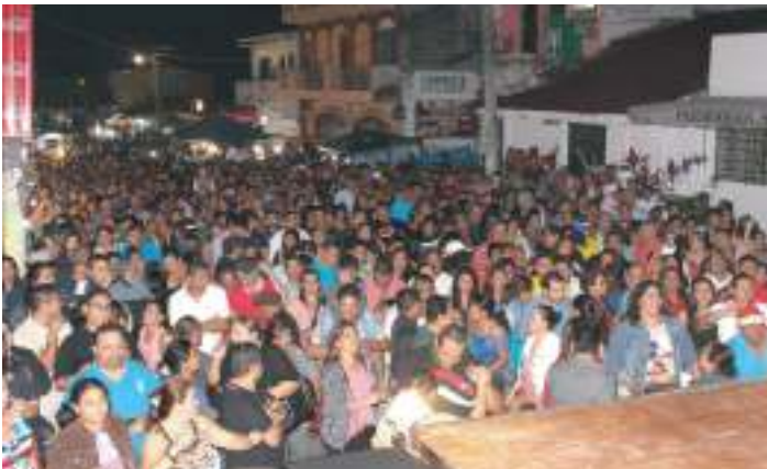
Carnaval Navideño en calles principales de Antigua Cuscatlán