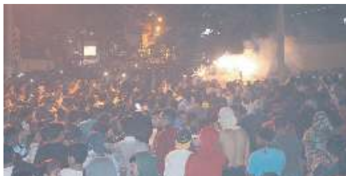
Tradicional quema de pólvora