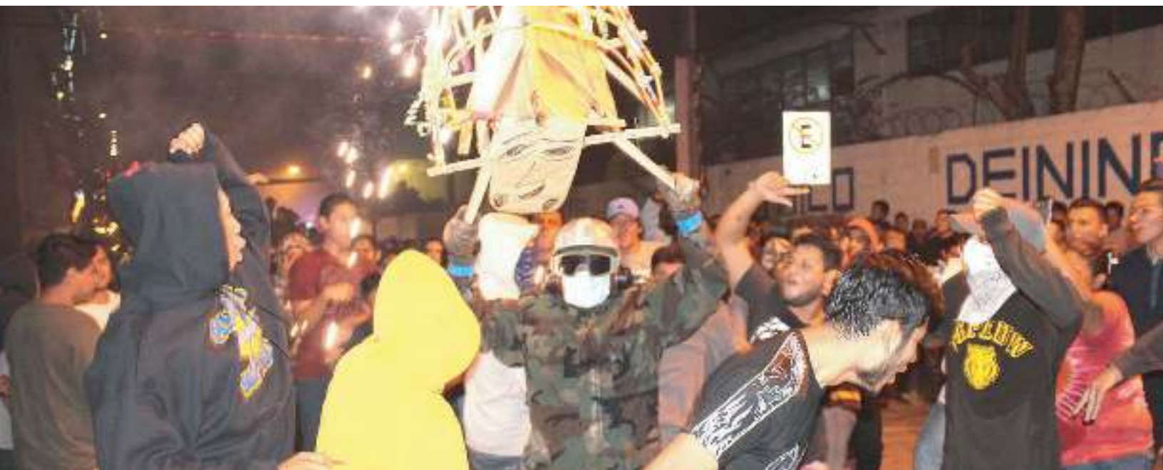
Tradicional quema de pólvora del 28 de diciembre de 2016