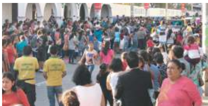
Recorrido del Desfile del Correo