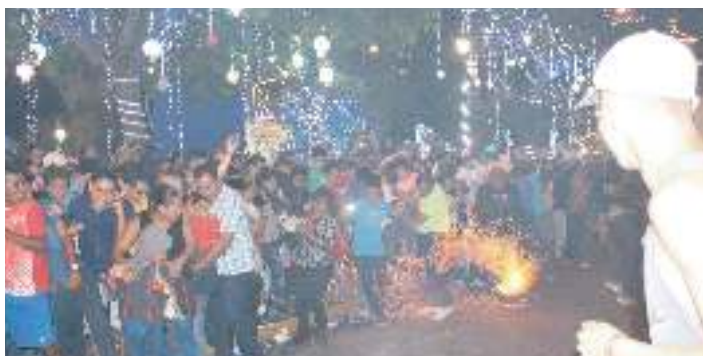
Quema de torito pinto en calles de Antigua Cuscatlán