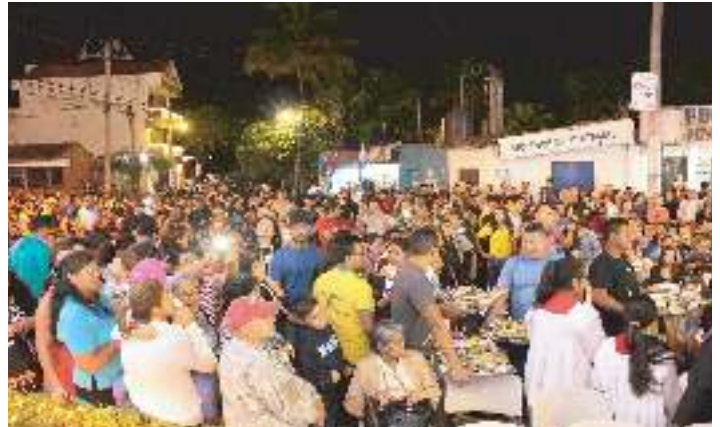
Repartición de refrigerio