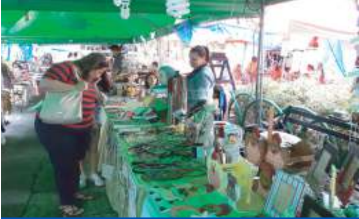
Artesano en festival gastronómico en el Parque Central