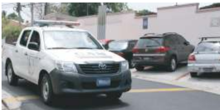
Patrullaje por todo el municipio

Además, se han entregado herramientas de trabajo a elementos del CAM, ya que se equiparon con un nuevo lote de 50 armas de fuego marca Prieto Beretta, calibre 9mm y una dotación de botas tipo jungla para el personal del CAM.