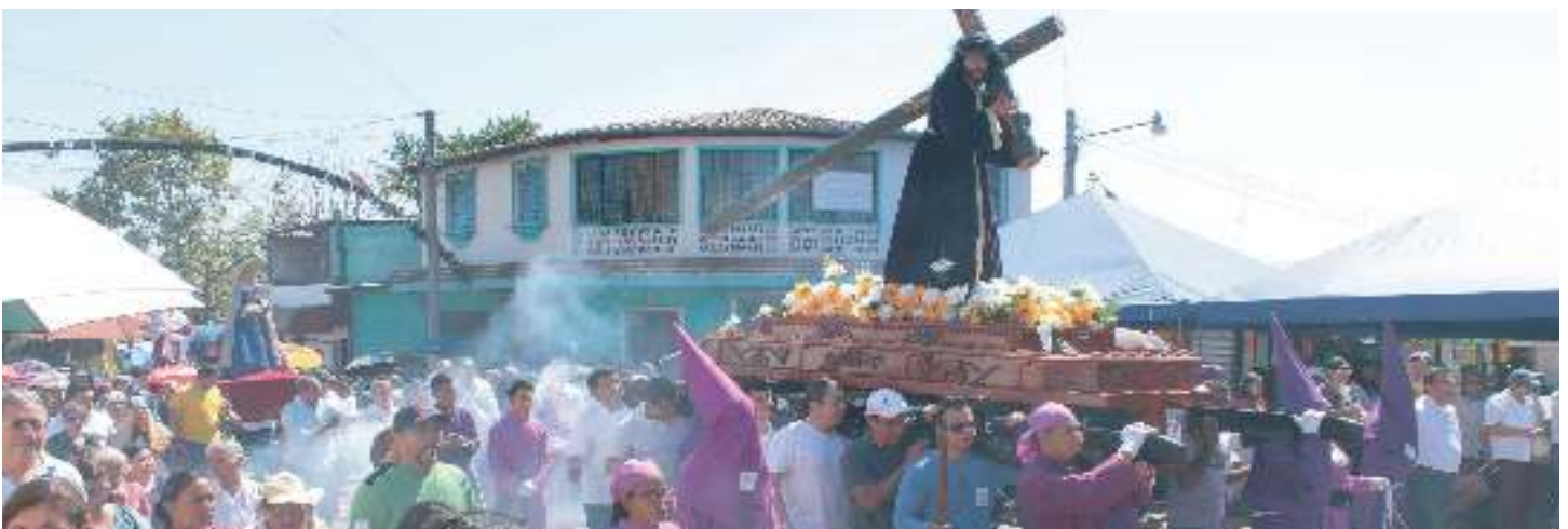
Vía Crucis de Semana Santa 2017