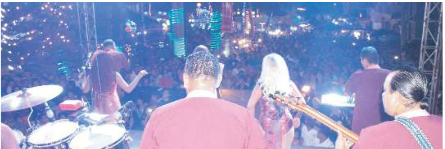
Carnaval Navideño en calles principales de Antigua Cuscatlán