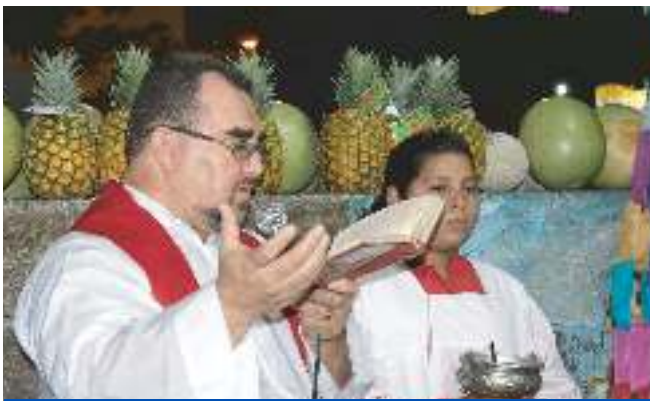
Celebración Día de la Cruz