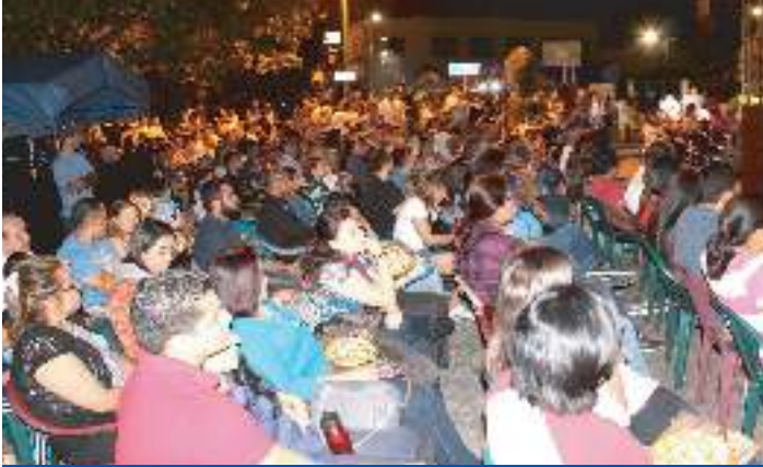
Concierto Grupo Amaretto en Santa Elena