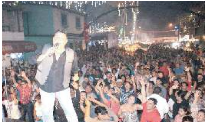
Carnaval Navideño en calles principales de Antigua Cuscatlán