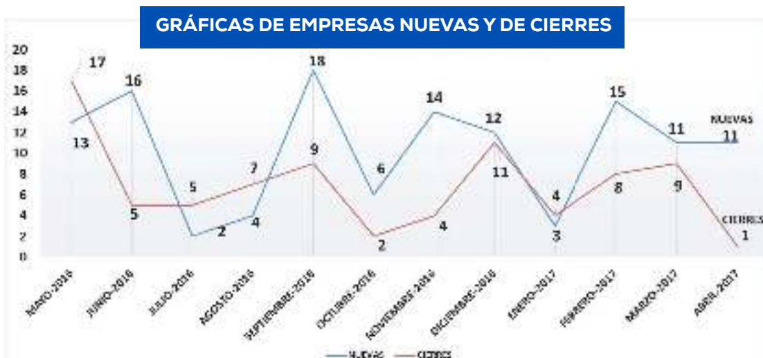
Gráfica de Líneas por mes y sus respectivos totales