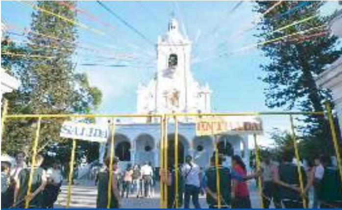
Celebración Basílica Nuestra Señora Guadalupe 11 y 12 dic.