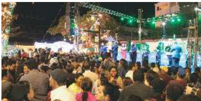
Noches Artísticas 2016: Orquesta Platinum