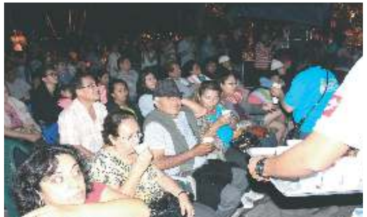
Fiestas Patronales 2016