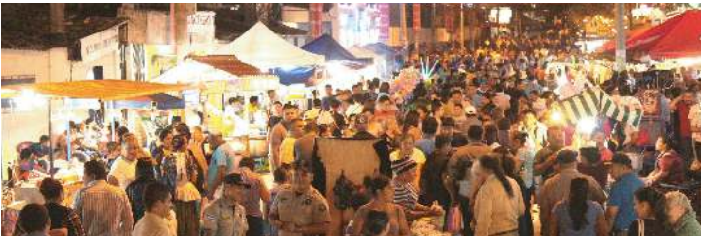
Día de los Santos Niños Inocentes: 28 de diciembre de 2016