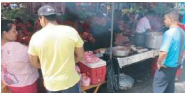
Rica gastronomía, comidas típicas y ricos postres