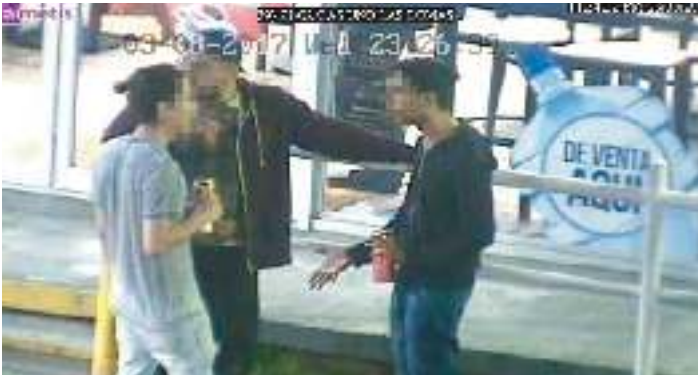
Aplicación de esquelas por consumo de bebidas alcohólicas en lugares no autorizados. Art.45