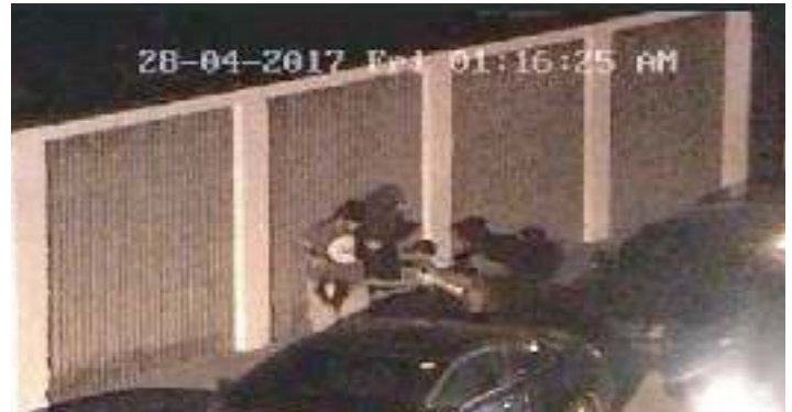
Delitos: Sujetos armados a bordo de vehículo cometen robo posteriormente capturados