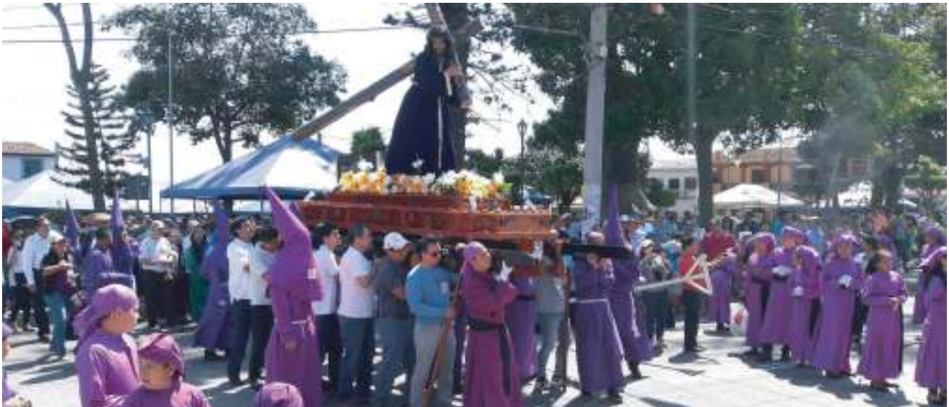
Actividades Religiosas de Semana Santa

Con el objetivo de fomentar y conservar entre los habitantes de Antigua Cuscatlán nuestras costumbres y tradiciones culturales y religiosas, la Alcaldía de Antigua Cuscatlán realizó diferentes actividades. Celebramos nuestras Fiestas Patronales en honor a los Santos Niños Inocentes, el Día de la Cruz, el Concurso de Alfombras 2017, entre otros eventos.