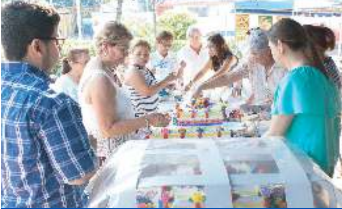
Agasajo a madres de Antigua Cuscatlán