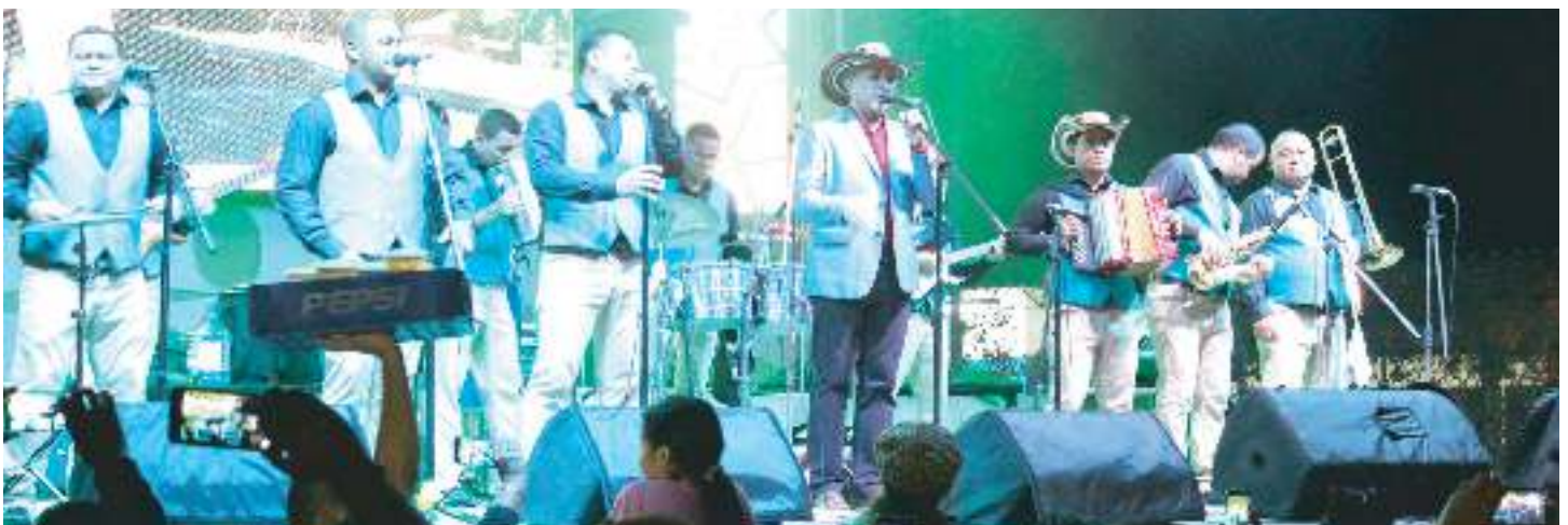
Fiestas de Gala en calle principal