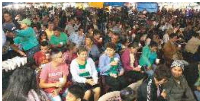
Noches Artísticas 2016: Entrega de refrigerios