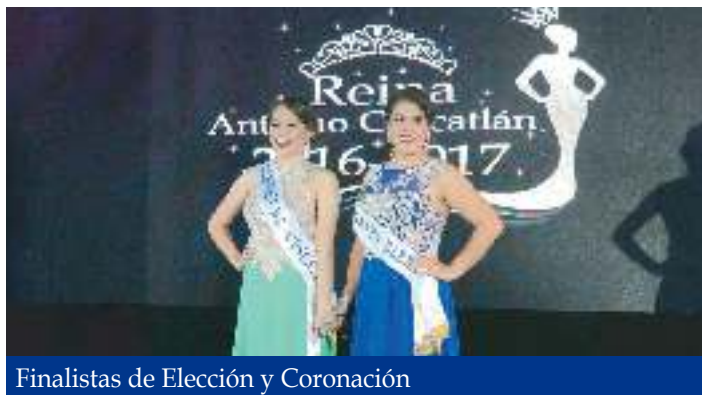
Finalistas de Elección y Coronación