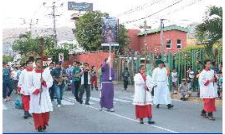
Procesión de los Santos Niños Inocentes