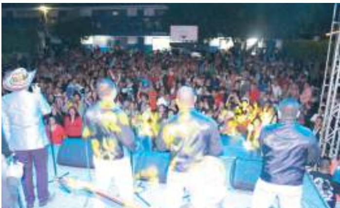
Fiesta de Gala en calle principal