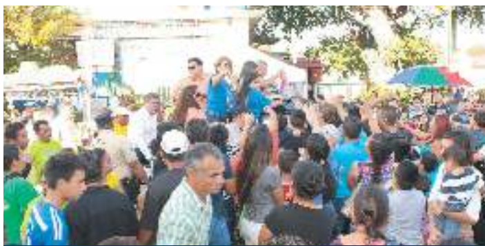
Concejales en recorrido del Desfile del Correo 2016