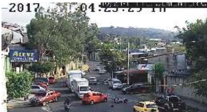
Lesiones: accidentes de tránsito