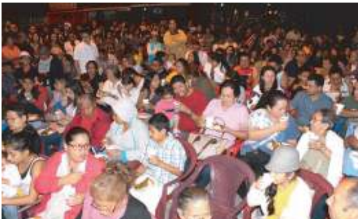
Repartición de refrigerio