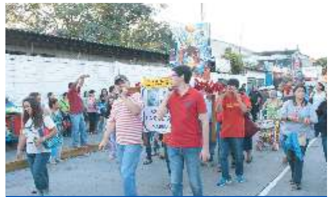
Fiestas Patronales 2016