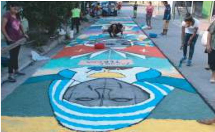
Concurso de alfombras en Semana Santa 2017