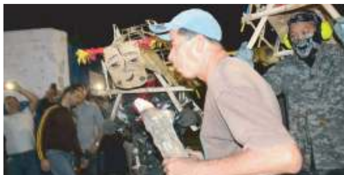
Fiestas Patronales Antigua Cuscatlán: Tradicional quema de pólvora