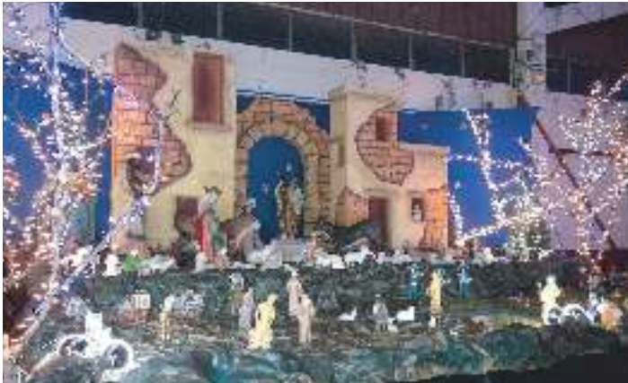
Nacimiento de Jesús en Mercadito de Merliot