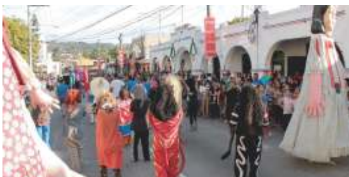
Alegría y diversión en Desfile del Correo