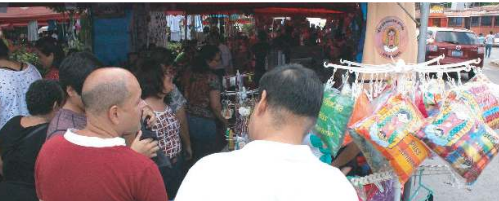
Festivales Gastronómicos: dinamización de economía de micro y pequeños empresarios