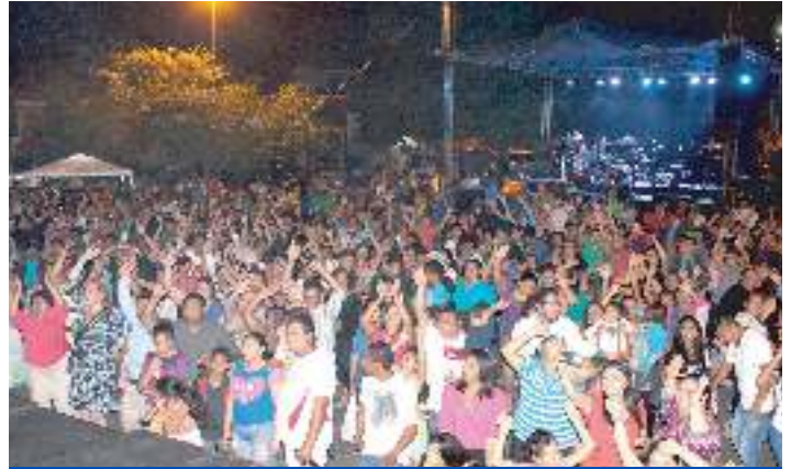
Carnaval en Ciudad Merliot