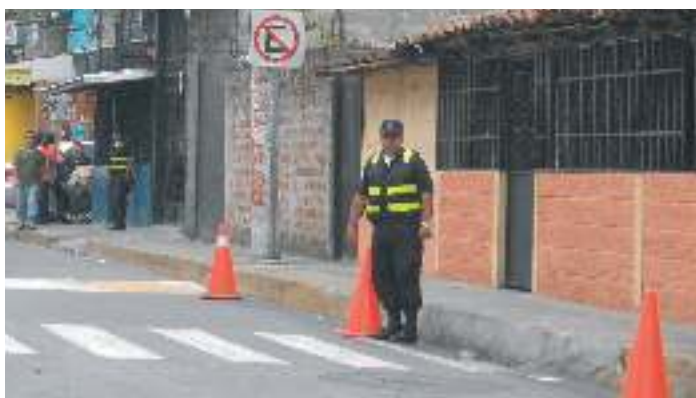
Agentes municipales de tránsito del CAM