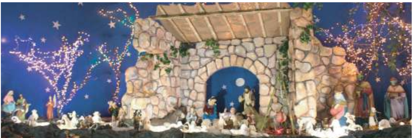
Nacimiento de Jesús en Parque Central