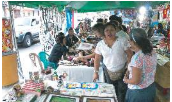
Dinamización de economía de microempresarios