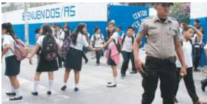
Seguridad ciudadana en Centros Escolares