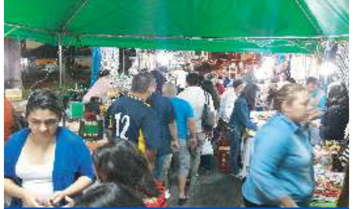
Artesano en festival gastronómico en el Parque Central