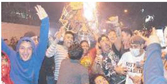
Quema de torito pinto