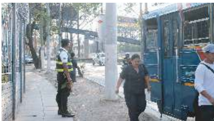
Seguridad en paradas de buses