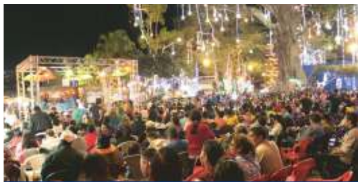
Fiestas Patronales 2016