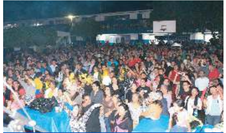
Fiesta de Gala en calle principal