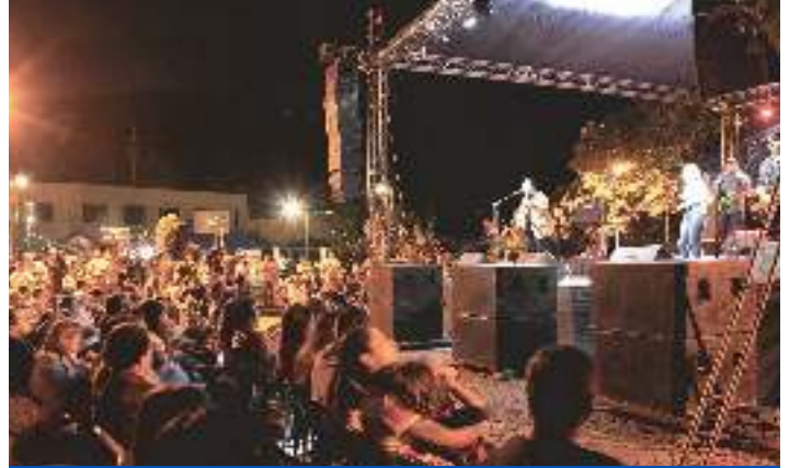
Concierto Grupo Amaretto en Santa Elena