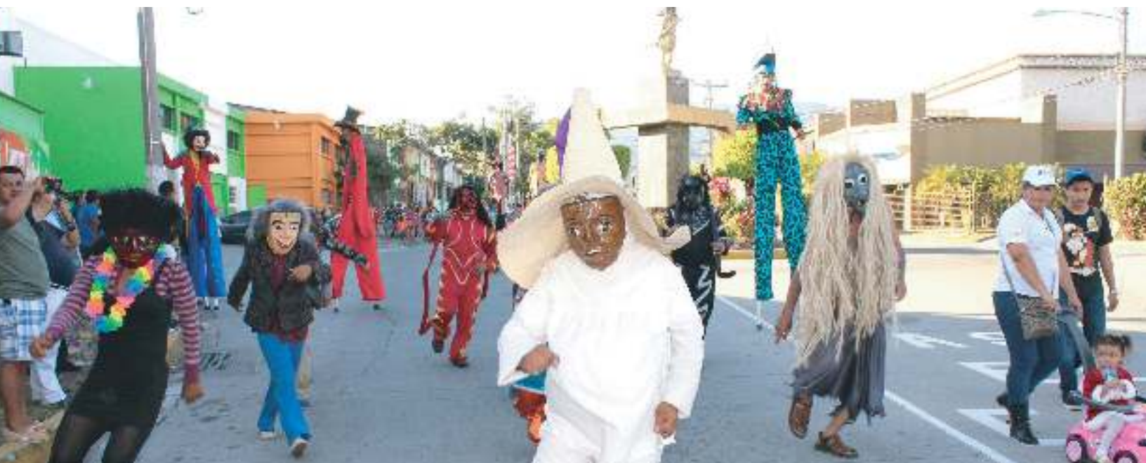
Los viejos de agosto acompañaron nuestro tradicional Desfile del Correo