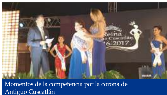
Momentos de la competencia por la corona de Antigua Cuscatlán