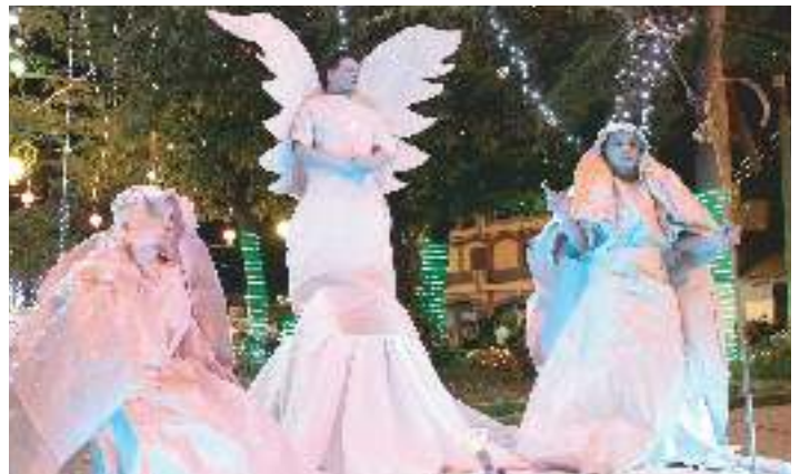
Estatuas vivientes en Parque Central