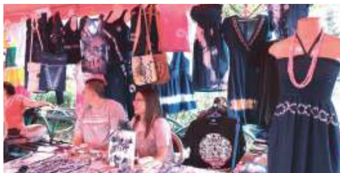
Artesanos venden sus productos