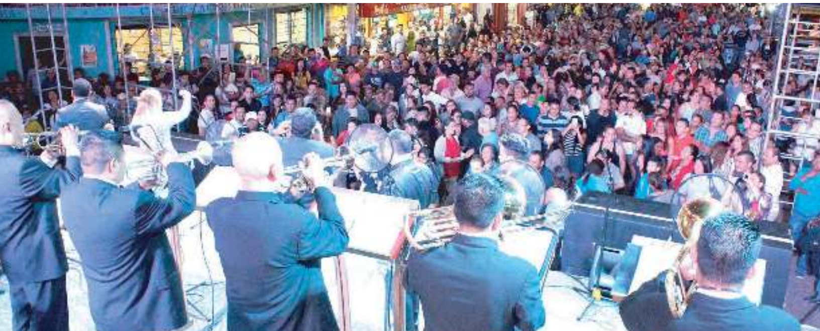
Noches Artísticas 2016: Orquesta Premier