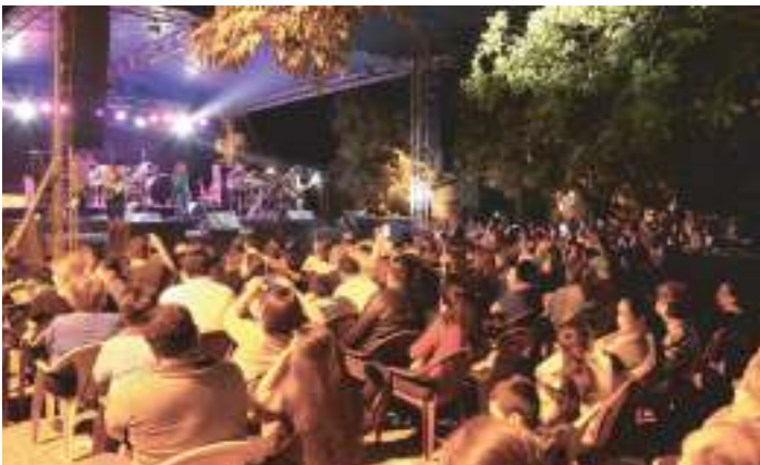
Asistentes disfrutaban del concierto