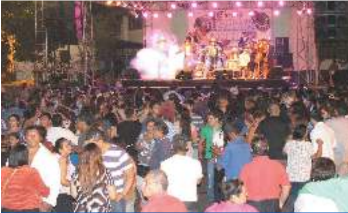
Carnaval en Ciudad Merliot