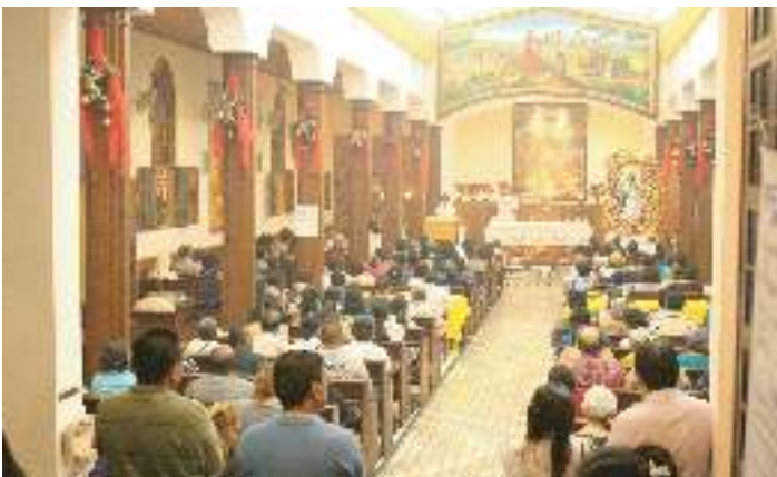
Misa en Parroquia Santos Niños Inocentes