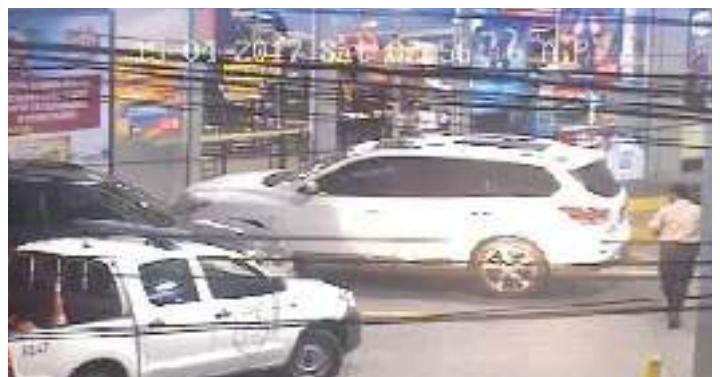
2. Se detectó robo a Gasolinera UNO Casino Colonial