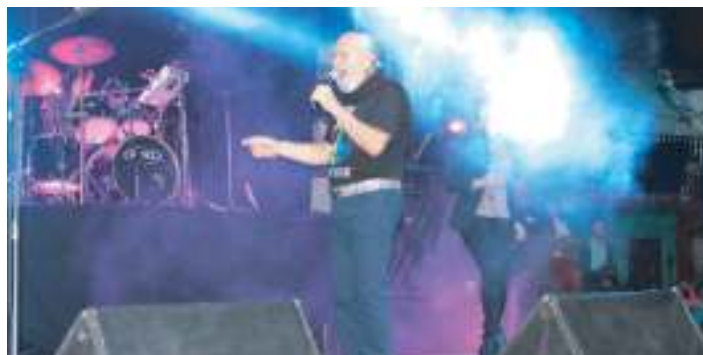
Noches Artísticas 2016: Concierto de Buenas Épocas