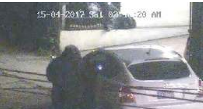
1. Se detectó robo a Gasolinera UNO Casino Colonial