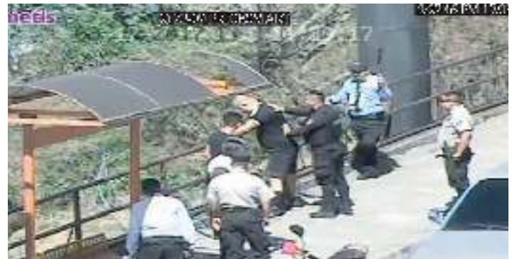
Prevención de hechos delictivos: revisión de sujetos sospechosos.