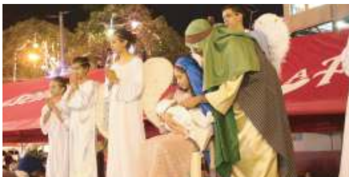
Noches Artísticas 2016: Pastorela en vivo