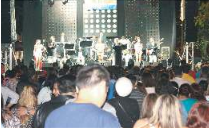
Fiesta de Gala en calle principal