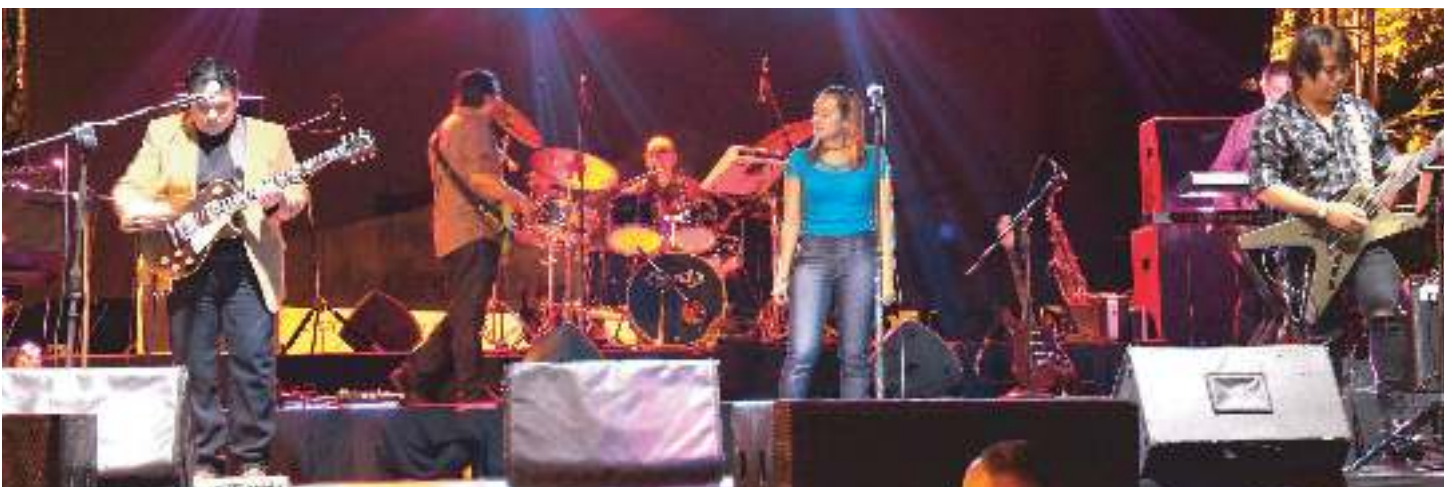
Fiestas Patronales, Concierto Grupo Amaretto, Parque Madreselva, Santa Elena