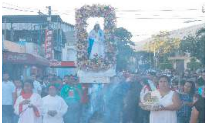
Procesión de entrada de Santa Juana