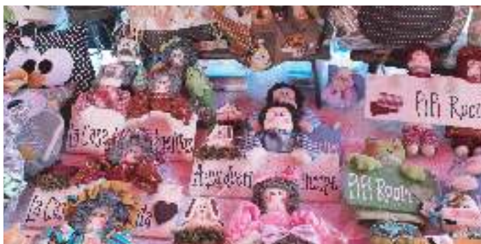
Festival Gastronómico, feria de artesanías y más