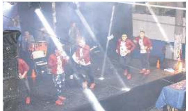
Fiesta de Gala en calle principal