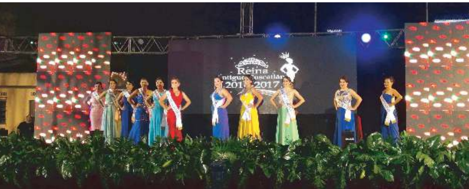
Candidatas en traje de noche en Elección y Coronación de Antigua Cuscatlán 2016-2017